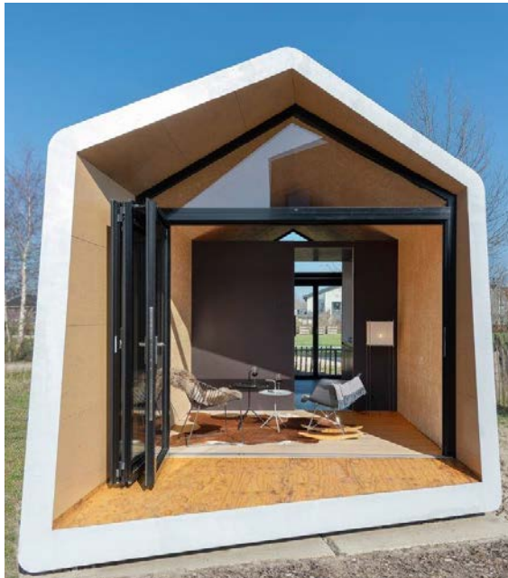
SL-SNUK-DSC5306: Vorder- und Rückseite sind mit Glas-Faltwänden ausgestattet, mit denen sich die Fronten komplett öffnen lassen.