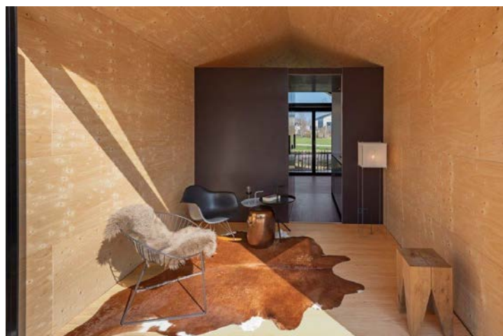
SL-SNUK-DSC5189: Ein Raumteiler in der Mitte separiert Wohn- und Schlafbereich voneinander.