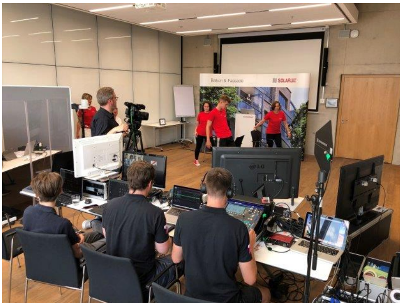
Solarlux-Virtuelle-Konferenz-2: Die „Bewegte Mittagspause“ animiert zum Mitturnen unter Kollegen – im Live-Streaming.